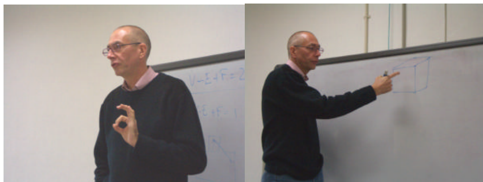
Prof. Graham Priest

This paper discusses the notion of mathematical proof to be found in Imre Lakatos' Proofs and Refutations, which is very different from the usual foundationalist notion. I will discuss to what extent it applies in mathematics, and then turn to the question of proof in logic.